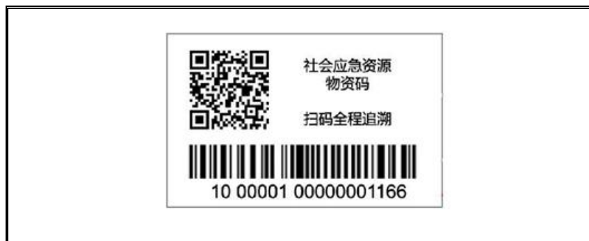
示例 1 产品标志耐久性标签